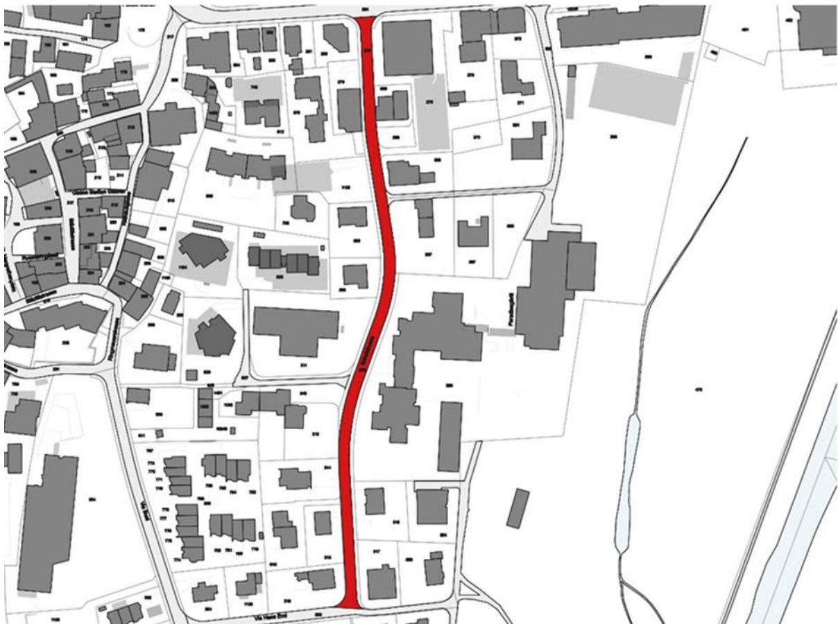
Abbildung 1: Ausschnitt Stadtplan Ilanz.

Die letzte grosse Erneuerung der Schulstrasse liegt bereits vier Jahrzehnte zurück. Um 1990 wurden die Schwellen zur Verkehrsberuhigung erstellt. Die Schulstrasse in Ilanz ist deshalb in die Jahre gekommen und in einem schlechten Zustand. Eine ungenügende Fundation und eine hohe Verkehrsfrequenz haben der Substanz stark zugesetzt. Die Strassenentwässerung muss erneuert und vom Abwassernetz getrennt werden.