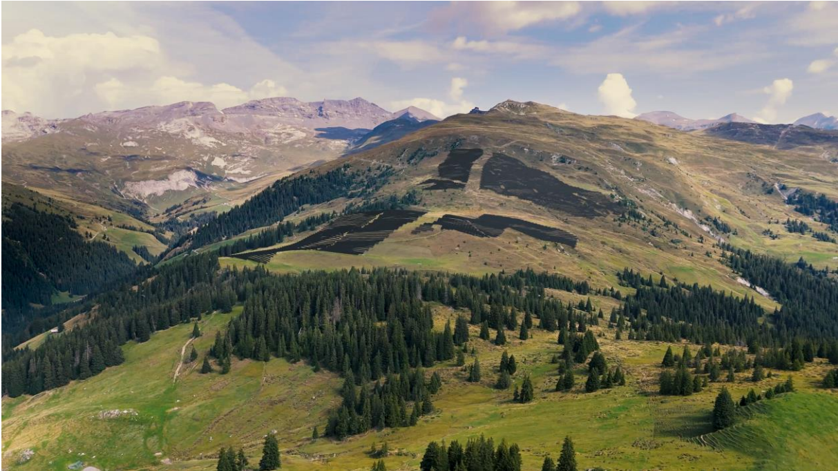
Abbildung 1: Visualisierung Oвра Solara Camplauns